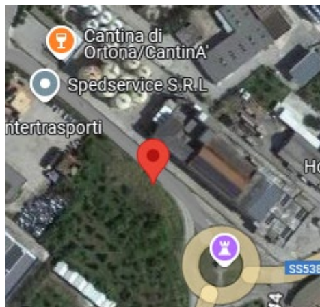
PUNTO DI MISURA - NORD 2 - OR091_1_FR_A